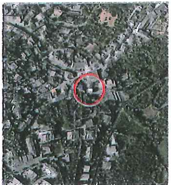
Inquadramento Foto aerea Google Earth