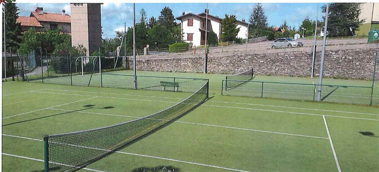
CAMPI DA TENNIS E CALCIO A 5 ERBA SINTETICA