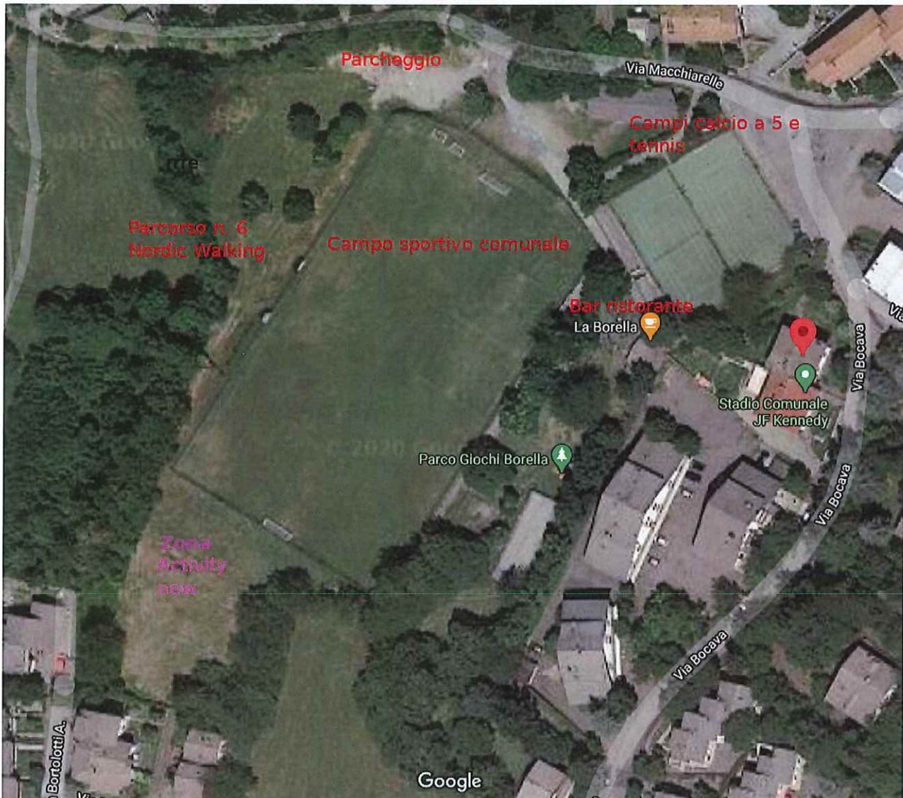
mappa centro sportivo J.F KENNEDY

Vedi foto seguente denominata ZONA ACTIVITY NEW (COLORE VIOLA)