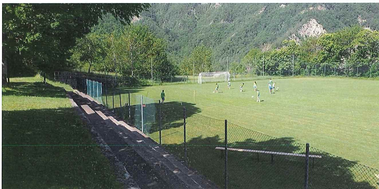
CAMPO DA CALCIO A 11

Negli sport fun o di gruppo la componente tecnica in genere li rendono più divertenti degli sport fit. Alla componente tecnica spesso è associata una componente muscolare e anaerobica importante, quello che manca è la continuità e la durata dello sforzo, cioè la componente di resistenza di media e lunga durata. In genere, tutti gli sport fun necessitano, per essere praticati in sicurezza e a un livello discreto, di una base muscolare ed aerobica che viene allenata tramite gli sport fit, pertanto è necessaria un'area fitness all'aperto.