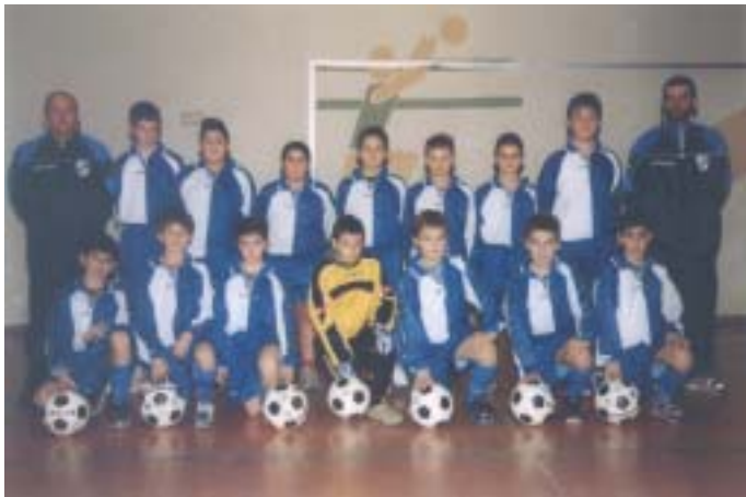
Una formazione giovanile della Polisportiva