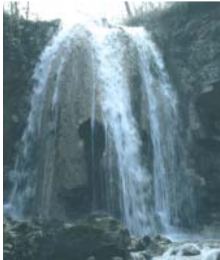
“La Maestà” del Rio Siano

nate di “Fiumi Puliti 2004”, in programma il 27 e il 28 marzo. Coinvolte nel progetto le scuole medie di Serramazzoni, le G.G.E.V. locali e della Provincia di Modena, il Gruppo Naturalistico “Ofiolite” di Varana e il Gruppo Naturalistico “Bucamante” di Riccò, il C.A.I. (Club Alpino Italiano), i gruppi Associazione Nazionale Alpini e tutti coloro che vorranno collaborare. La S.A.T. e la Provincia metteranno a disposizione il materiale per la pulizia. Il luogo di ritrovo per i partecipanti è lungo la strada che da Casa Bartolacelli porta a Vara-