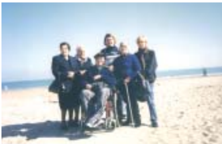
Un momento ricreativo organizzato dal Servizio Assistenza Domiciliare del Comune

Il Comune di Serra, con la sottoscrizione, con ognuna delle associazioni del volontariato sociale presenti in paese, in particolare con l'Avap, con le associazioni "Cinquantuno e Più", "A Casa di Giulia", "L'Arco", e i gruppi Caritas delle parrocchie del territorio, di specifiche convenzioni finalizzate alla realizzazione di concreti progetti per migliorare la qualità della vita degli anziani, dei minori, delle famiglie in difficoltà, dei disabili, degli ammalati. Un provvedimento che attua la precisa scelta di operare, nel settore dei servizi sociali, educativi, assieme alle associazioni, e quindi con le persone di Serra che dedicano una parte del proprio tempo in favore della comunità.