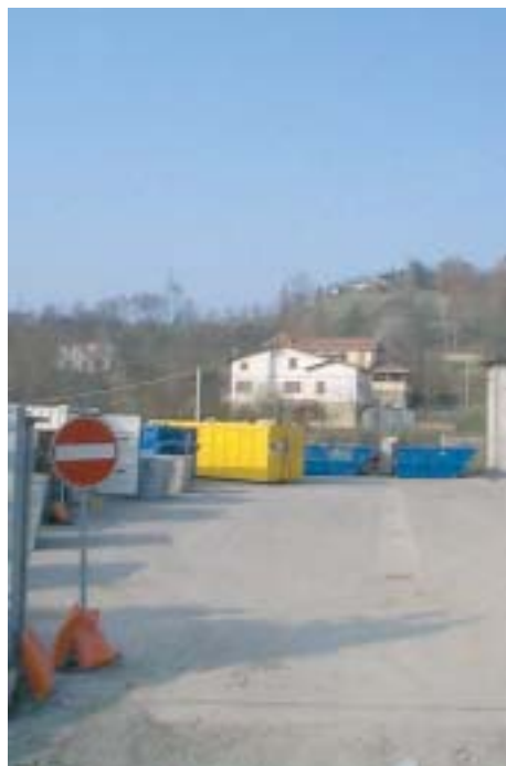
L'isola ecologica di Serramazzoni

La prevenzione dei rifiuti, infatti, comporta un minore impatto ambientale, un risparmio di risorse naturali, e un calo dei costi di smaltimento. Ricordiamo poi alla cittadinanza di non abbandonare i rifiuti ingombranti (lavatrici, frigoriferi, stufe) vicino ai cassonetti per la raccolta della spazzatura, lungo le scarpate o nei boschi, ma invece di conferirli all'isola ecologica comunale: Raccoglierli costa molto-portarli all'isola ecologica non costa nulla. A seguire, ecco un promemoria che vuole essere anche un invito a scoprire, per chi ancora non l'avesse fatto, l'isola ecologica di Serra. Uno spazio attrezzato, dove il cittadino può conferire i rifiuti che possono essere riciclati, quelli pericolosi per l'ambiente o i rifiuti ingombranti.