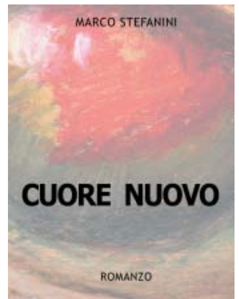
La copertina del romanzo

simpatico e attraente. Il romanzo? Piace. Il ritorno, da parte dei lettori, è buono. La storia presenta una trama coinvolgente, capace di assumere la tecnica narrativa della cinepresa che lavora a tutto campo, rinunciando alla selezione delle immagini e, quindi, coinvolgendo il lettore in un crescendo di intensità emotiva che lo "costringe" a voltare pagina per vedere come andranno a finire le cose".