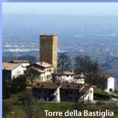
Torre della Bastiglia