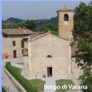
Borgo di Varana