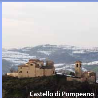
Castello di Pompeano