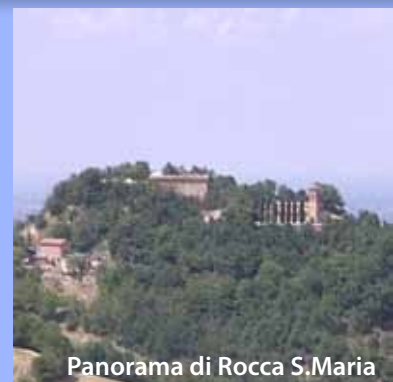
Panorama di Rocca S.Maria