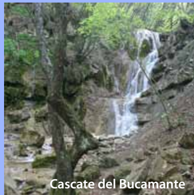
Cascate del Bucamante