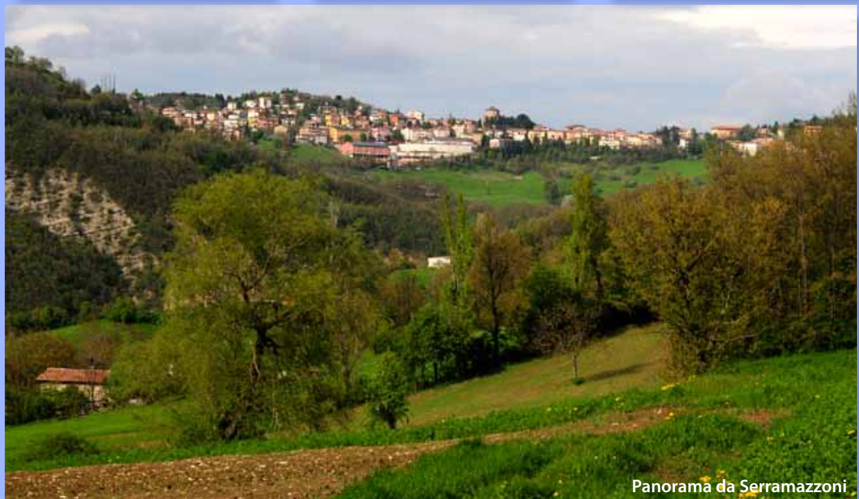
Panorama da Serramazzone